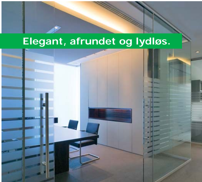
Portavant - døren, som ... ... beskytter.