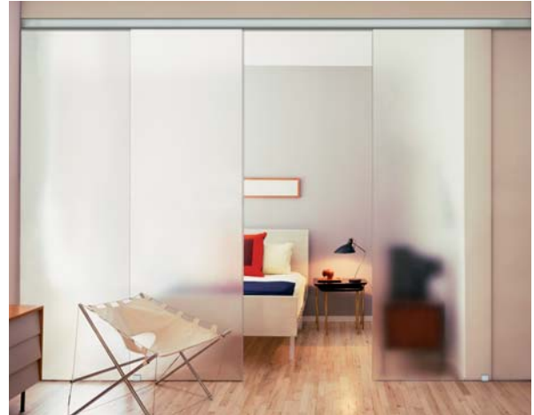
Portavant - døren, som.. ... drager.

Portavant fra Willach er et innovativt system til alle glasskydedøre der sætter nye standarder.